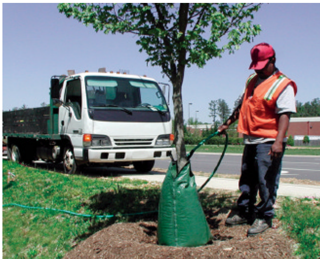
Llenado de Treegator® Original

La unión de dos bolsas mediante la cremallera lateral, permite regar árboles con troncos de hasta 20 cm de diámetro.